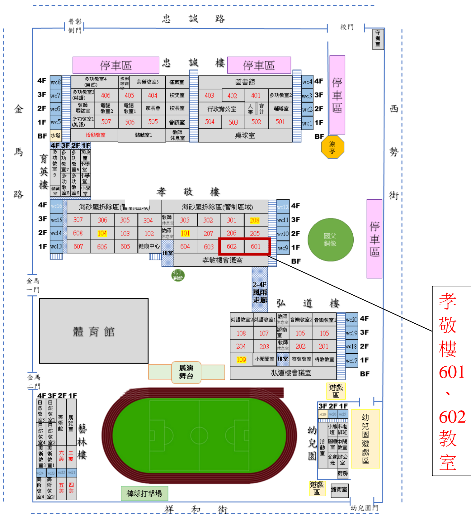
彰化縣彰化市忠孝國民小學 112 學年度校舍配置圖