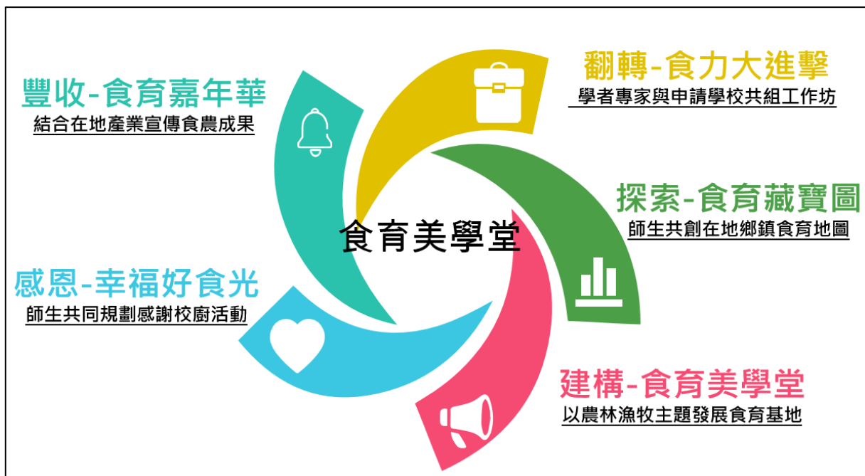
圖 2 本縣食育美學堂概念圖